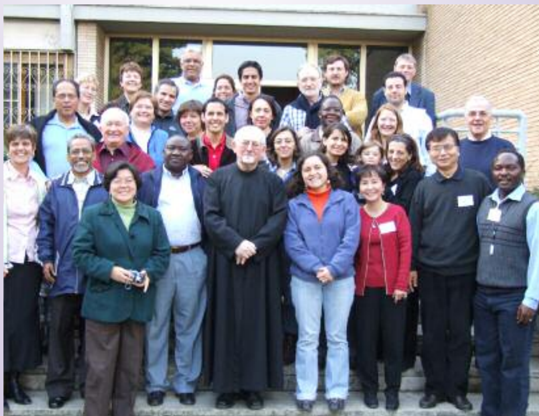
Fr. Kolvenbach avec les participants de la Rencontre Internationale de Formation à Rome, 2006